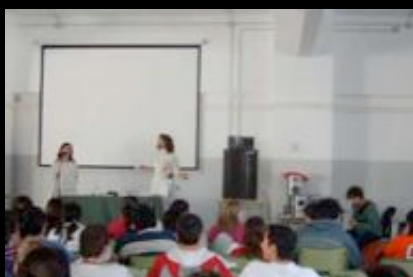
IES en Cádiz. Febrero 2005

Creamos nuestra opinión y propuesta de contra-información a través de los polipoemas. A partir de la puesta en escena sugerimos una complicidad con el espectador, un atrevimiento y en definitiva, una invitación a participar - desde el concenso o el discenso - con nuestra contribución al pensamiento y a la expresión crítica acerca del momento que nos ha tocado vivir.