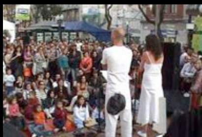
Ramblas de Tarragona. Abril 2007