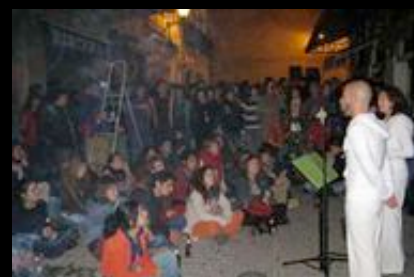
Mercado de la Calle Feria Sevilla, Noviembre 2007